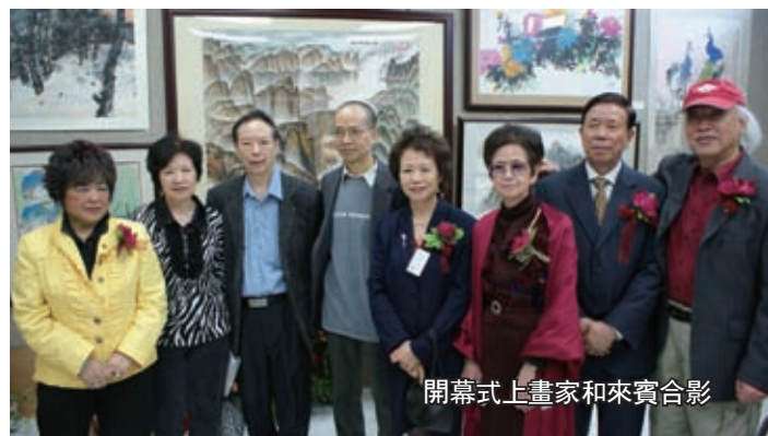
開幕式上畫家和來賓合影

中國畫的傳統，也研習西方藝術；在當地華社及主流社會為著名的畫家及雕塑家，現任安省中國美術會副會長。